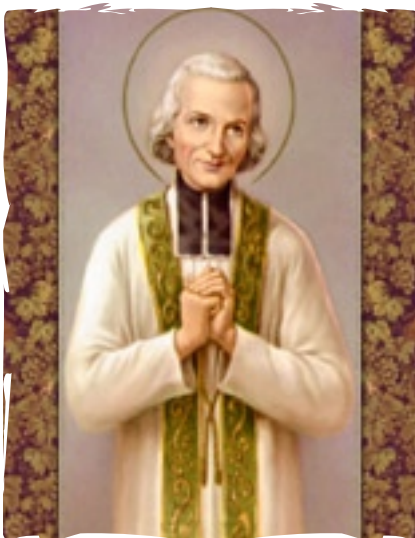
St Jean-Marie Vianney, le Curé d'Ars