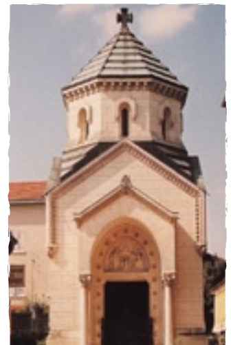
Chapelle du Curé d'Ars

C'est certainement parce qu'il n'a pas montré de brillantes aptitudes intellectuelles comme séminariste que le prêtre diocésain Jean-Marie Vianney, qui deviendra le saint curé d'Ars, est envoyé dans cette petite ville perdue dans la campagne et oubliée.