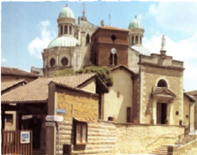
Sanctuaire de St Jean-Marie Vianney, le Curé d'Ars

Cependant, le Curé transforme la ville d'Ars en un important lieu de pèlerinage, grâce à sa sainteté, son énergie réformatrice et ses dons extraordinaires pour évangéliser et discerner la vie intérieure de ses paroissiens.